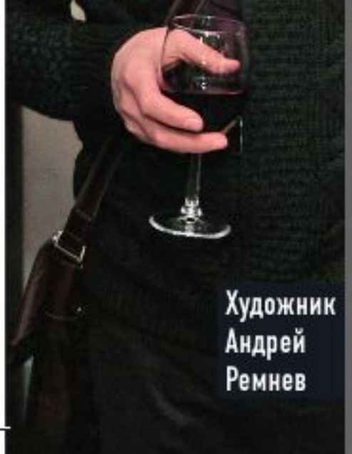
Художник Андрей Ремнев