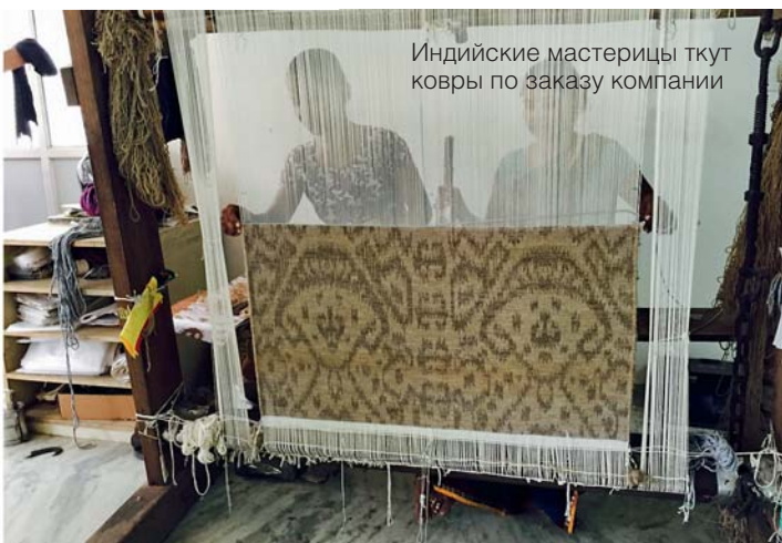
Индийские мастерицы ткут ковры по заказу компании

На наши вопросы отвечает Довлет Гельдымурадов