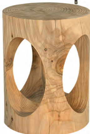
Табурет Ziba по дизайну Франсиса Кере, Riva 1920.