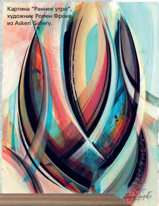
Картина "Раннее утро", художник Роман Фроке, из Askeri Gallery.