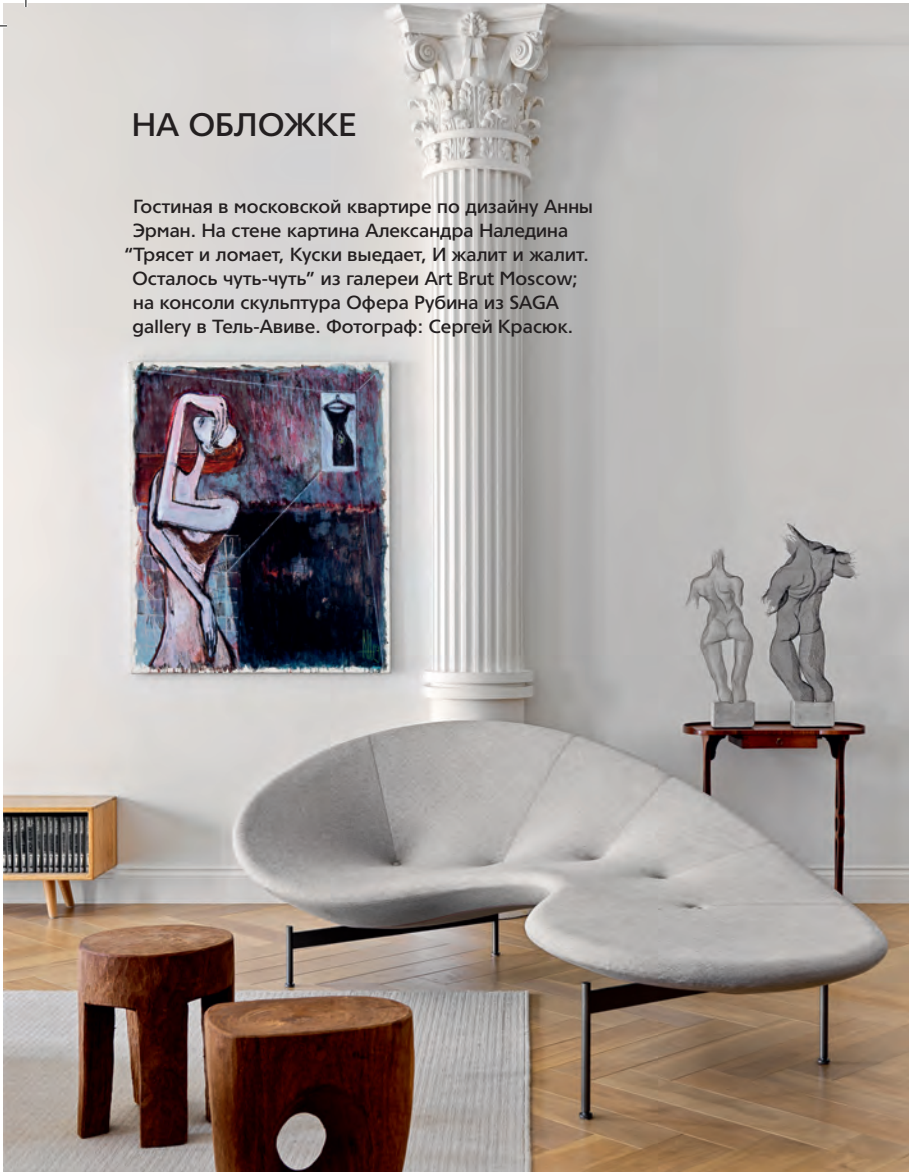
Ковер, Dovlet House.