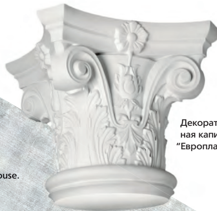
Декоративная капитель, "Европласт".