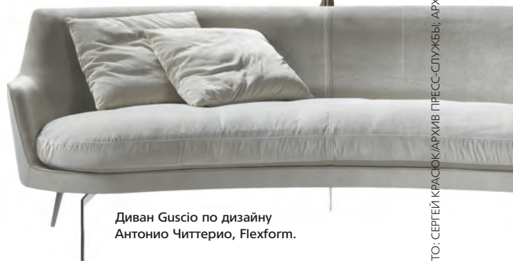
Диван Guscio по дизайну Антонио Читтерио, Flexform.