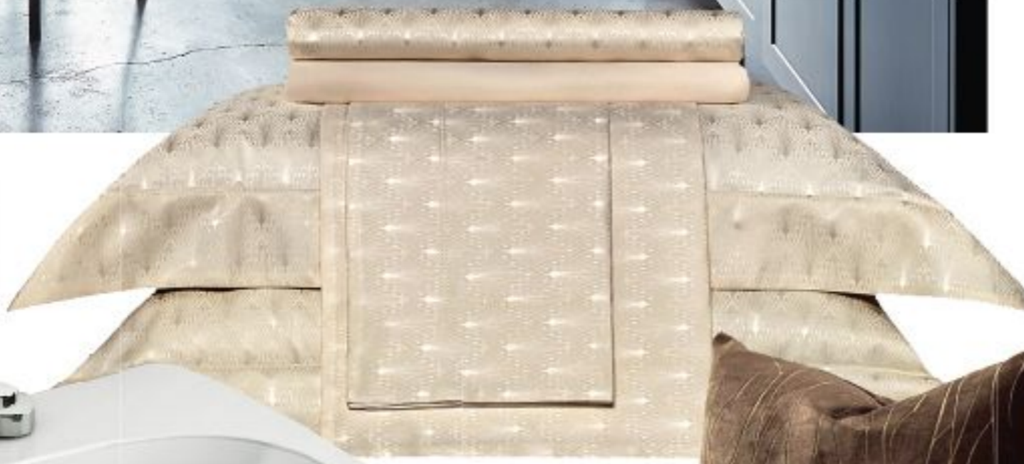
Комплект постельного белья "Артуа", шелк, хлопок, Togas.