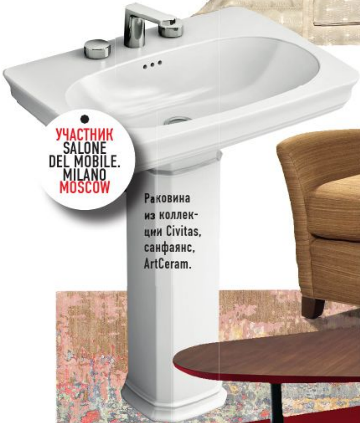
УЧАСТНИК SALONE DEL MOBILE. MILANO MOSCOW