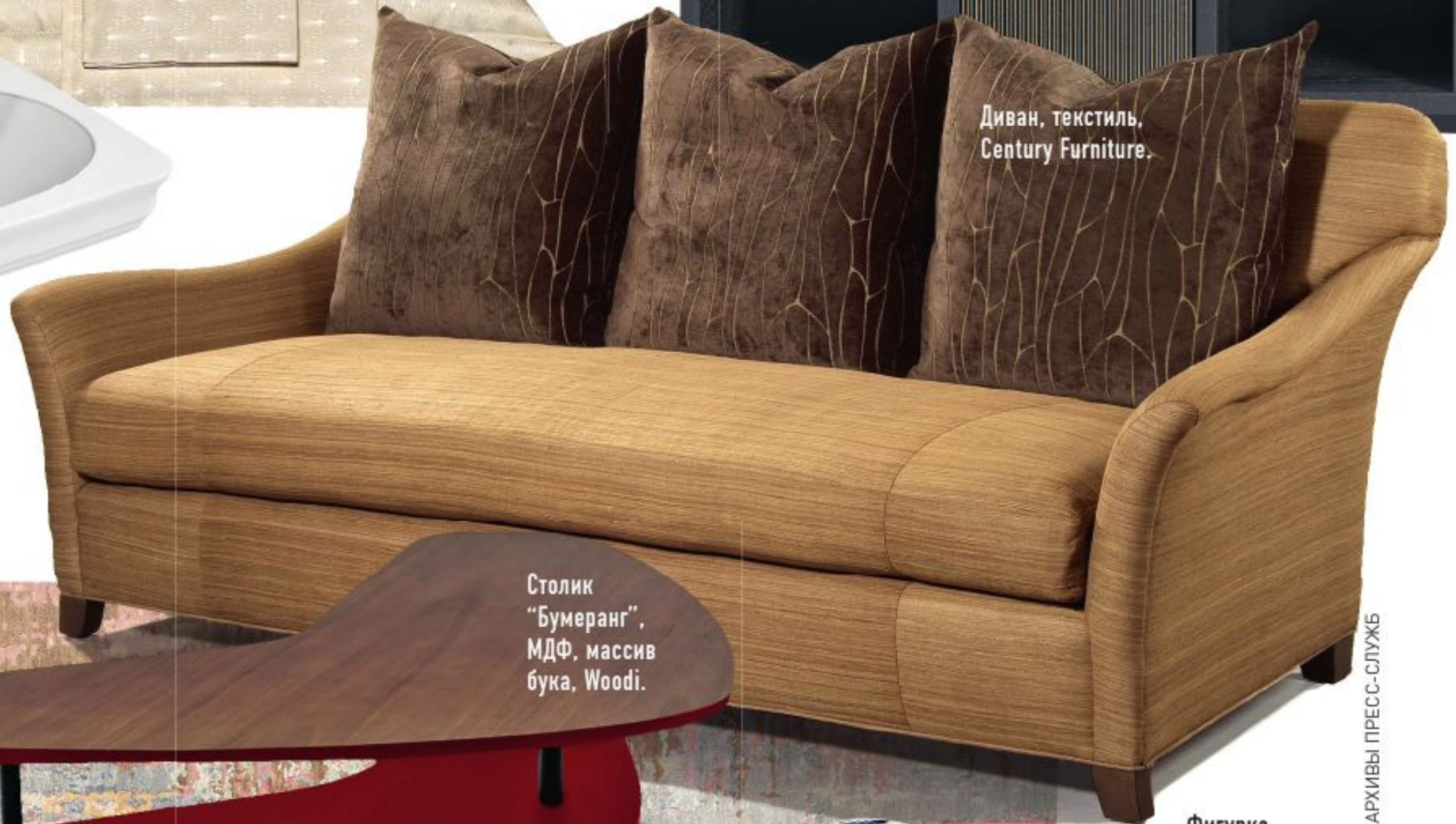
Столик "Бумеранг", МДФ, массив бука, Woodi.