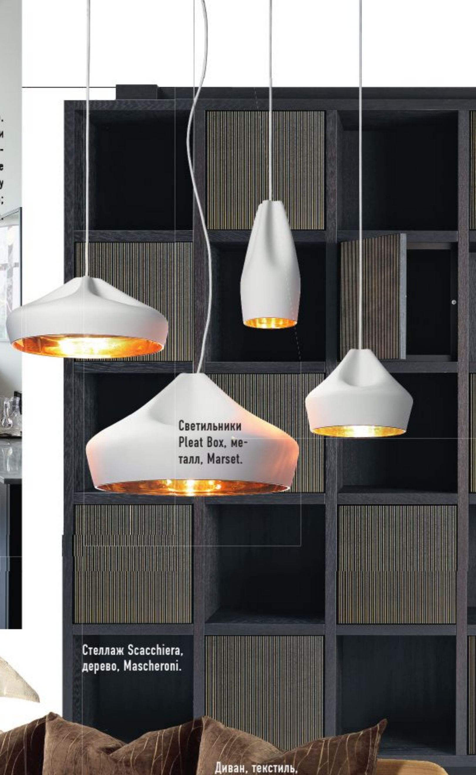
Светильники Pleat Box, металл, Marset.