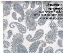
Шерстяное кружево, коллекция Paisley MYB Textiles, шоу-рум галереи Арсен