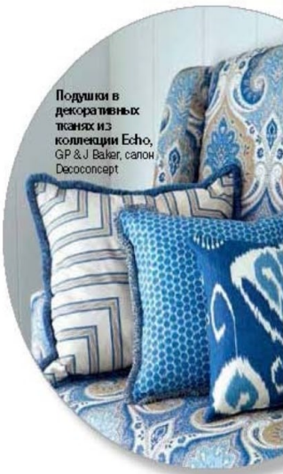
Подушки в декоративных павзах из коллекции Echo, GP & J Baker, салон Decosconcept