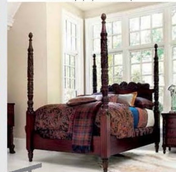
Спальня Safari, Ralph Lauren Home, шоу-рум Lege Ato