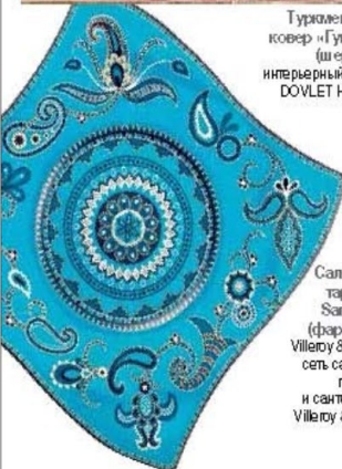
Салатная тарелка Sam arah (фарфор), Village & Boch, сел. салоны посуды и сантехники Village & Boch