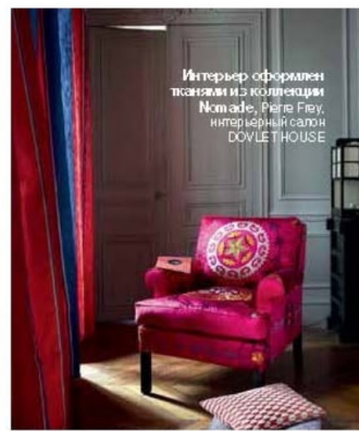
Интерьер оформлен тканями из коллекции Nomade, Pierre Frey, интерьерный салон DOVLET HOUSE

дерева, старинную живопись и современные арт-объекты, добиваясь эффекта гармонии. Принимая во внимание особенности погоды, дизайнер выбрал светлые и теплые природные цвета (топленое молоко, кремовый, белый, натуральное дерево), добавив для контраста немного темно-коричневого и черного.