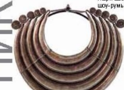
Декоративное украшение Andrew Martin, шоу-рум Andrew Martin