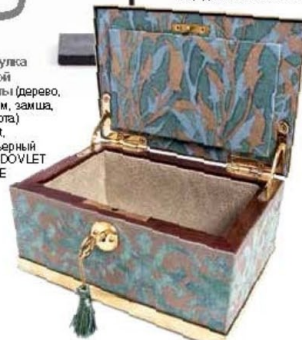
Шкатулка ручной работы (дерево, шербет, замша, позолота) L'Objet, интерьерный салон DOVLET HOUSE