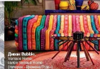
Диван Bubble Versace Home салон Утеза в Home (галерея «Времена года»)