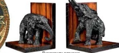
Держатели для книг, Theodore Alexander, бутик Theodore Alexander («Кроус Сити Молл»)