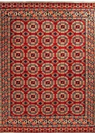
Туркменский ковер «Гушль» (шерсть), интерьерный салон DOVLET HOUSE