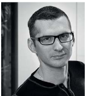
Авторы проекта Илья Шульгин, Кирилл Кочетов (архитектурное бюро Lofting)