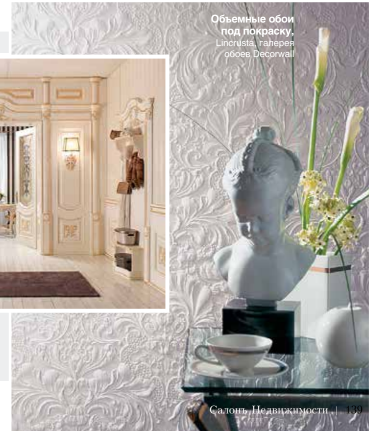
Объемные обои под покраску, Lincrusta, галерея обоев Decorwall