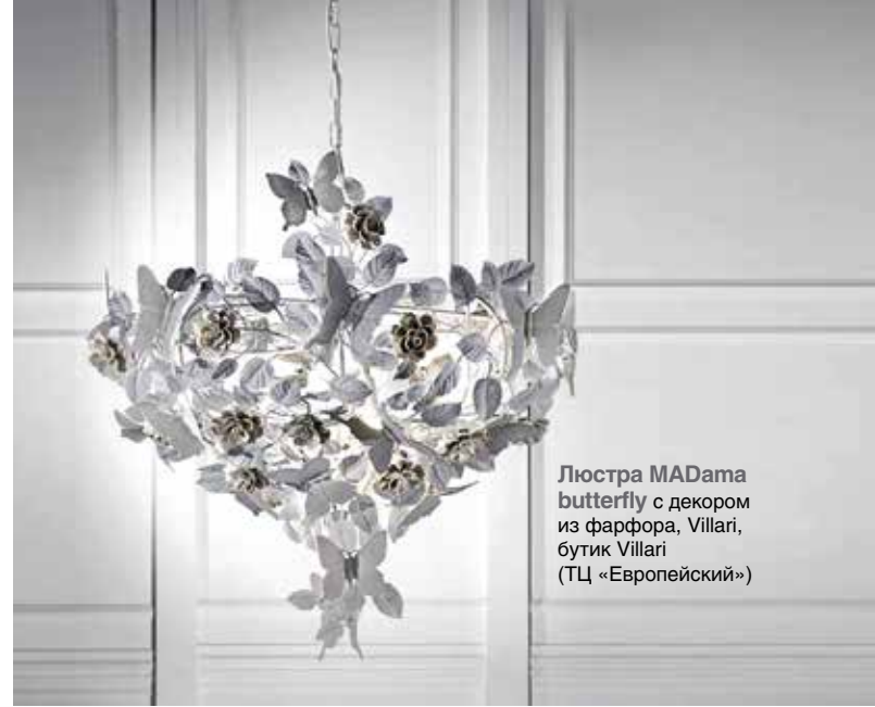
Люстра MADama butterfly с декором из фарфора, Villari, бутик Villari (ТЦ «Европейский»)