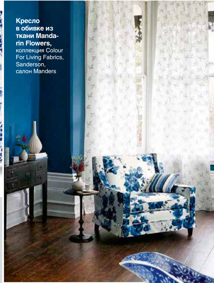
Кресло в обивке из ткани Mandarin Flowers, коллекция Colour For Living Fabrics, Sanderson, салон Manders