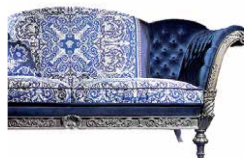
Диван Zag, Versace Home Collection, салон Versace Home (Галерея «Времена Годе»)