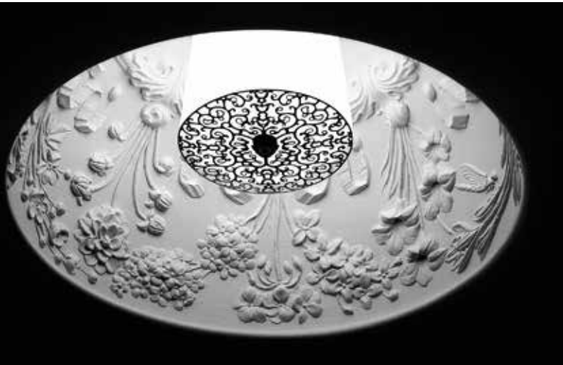
Люстра Skygarden, Flos, салоны «Трио»