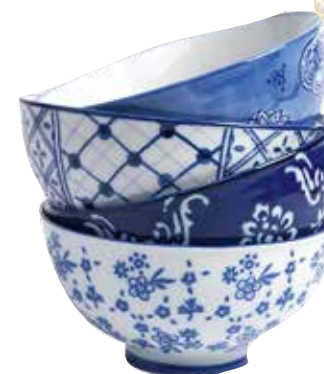
Набор фарфоровых пиал, Mercury, интернет-магазин www.dg-home.ru