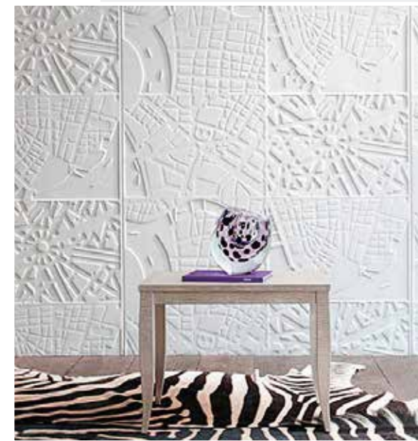
Настенное покрытие L'original, Elitis, компания Skol

Возрождению и популяризации традиции декоративной лепки во многом способствовал рост современных технологий, позволяющих заменить тяжелые и трудоемкие в изготовлении гипсовые детали на более легкие, сделанные из современных материалов (например, полиуретана), или же создать максимально правдоподобную обманку из фарфора, дерева или пластика.