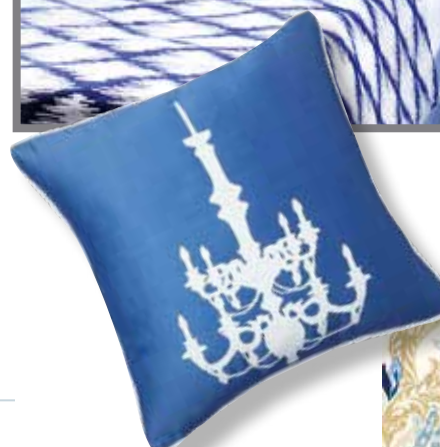
Подушка с принтом Chandelier Diamond-Blue, интернет-магазин www.dg-home.ru