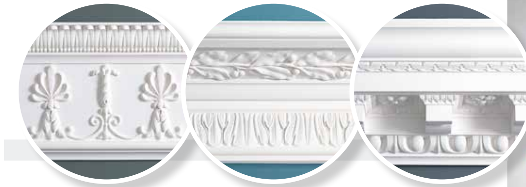
Лепной декор, Stevensons, салон Manders