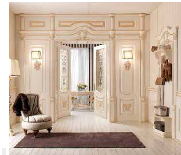
Межкомнатные двери и декор, коллекция Emozioni, New Design Porte, салоны дверей Union