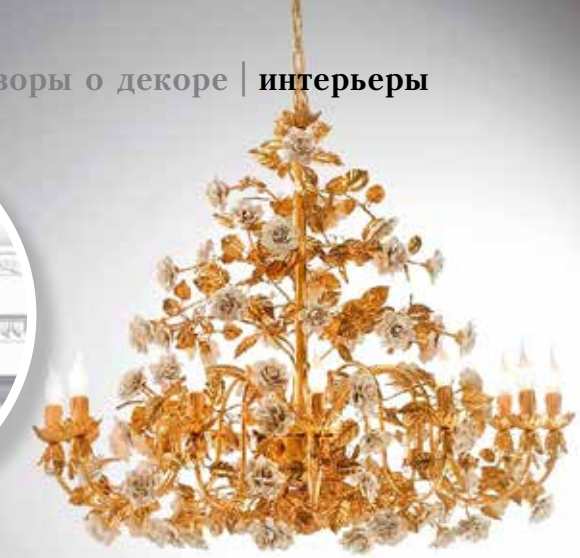
Люстра ручной работы с фарфоровыми розами, коллекция White & Gold, Villari, бутик Villari (ТЦ «Европейский»)