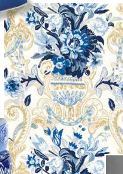
Льняная ткань Aylesbury Vase, Schumacher Fabric, компания «Москва-Рим»