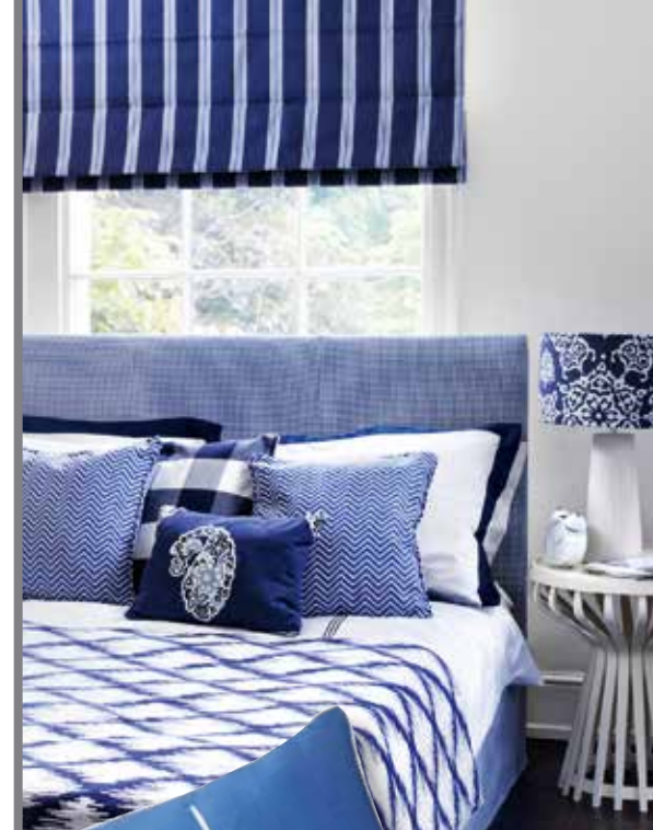
Ткани из коллекции Sonoma, Clarke & Clarke, шоу-рум «Галерея Арбен»