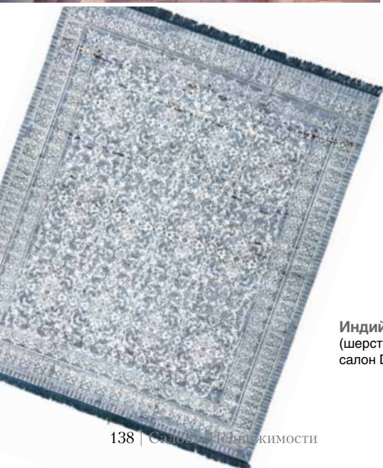
Индийский ковер агра (шерсть, шелк), интерьерный салон DOVLET HOUSE

Учитывая богатую историю и широкое распространение сине-белого фарфорового орнамента по всему миру, от Китая до России, ему находится место практически в любом стиле: и в пышном рококо, и в изысканном шинуазри, и в грубоватом колониальном, и в современном лофте. Причем не обязательно покрывать орнаментом каждый дюйм интерьера, иногда достаточно пары ваз, плитки или раковины, кухонных фасадов, ковра или штор, мебели или обоев, постельного белья или посуды.