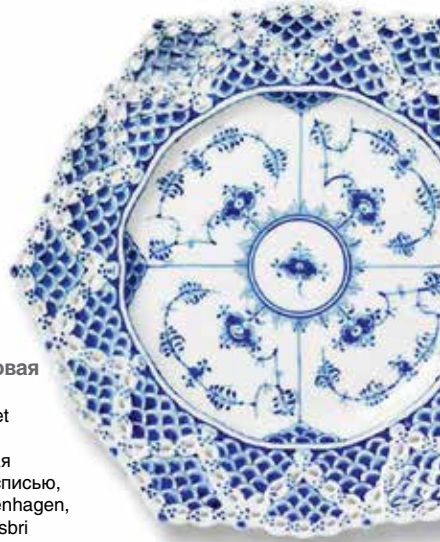
Фарфоровая тарелка Musselmalet Helblonde, украшенная ручной росписью, Royal Copenhagen, салоны Rosbri