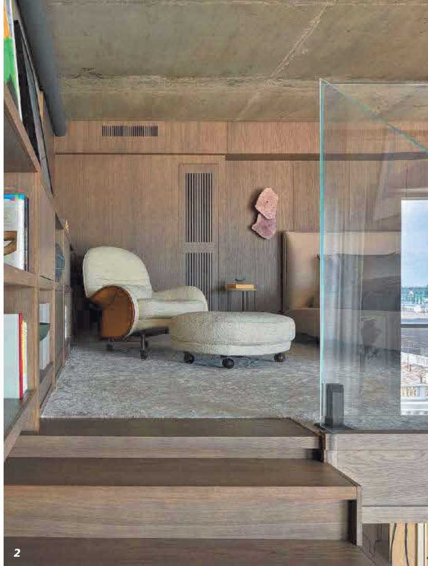
1, 2 В спальне кресло, De Padova; кровать, Minotti; ковролин, Dovlet House; бра, Christopher Boots; текстиль, AtelierTati. Потолок остался бетонным, без отделки, чтоб сохранить высоту. 3 Гостиная ванная. Тумба сделана на заказ; плитка, FMG; декор, Moon-stores.