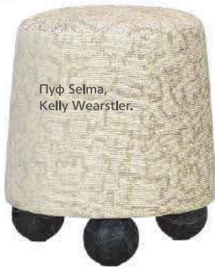
Пуф Selma, Kelly Wearstler.