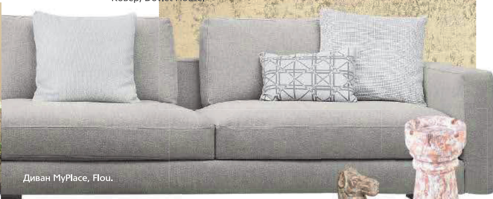
Диван MyPlace, Flou.