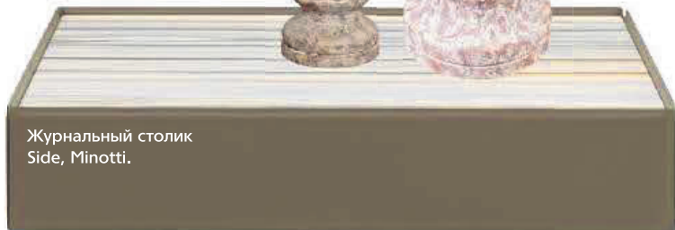
Журнальный столик Side, Minotti.

НА ОБЛОЖКЕ — ГОСТИНАЯ В ДОМЕ ДИЗАЙНЕРА ЭЛЕН КУЧЕРОВОЙ . МЫ ВЫБРАЛИ МЕБЕЛЬ И АКСЕССУАРЫ, КОТОРЫЕ ПОМОГУТ СОЗДАТЬ ПОХОЖУЮ ОБСТАНОВКУ.