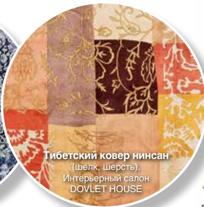
Тибетский ковер нинсан (шелк, шерсть). Интерьерный салон DOVLET HOUSE