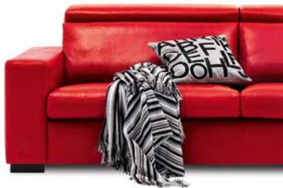
Диван Nago, VoConcept, шоу-рум VoConcept