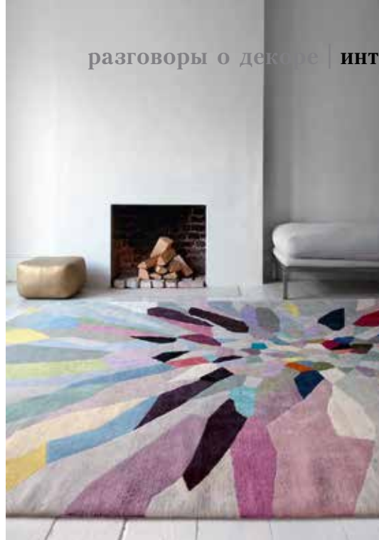
Тибетский ковер ручной работы Zap, художник — Фиона Карран, The Rug Company, шоу-рум The Rug Company