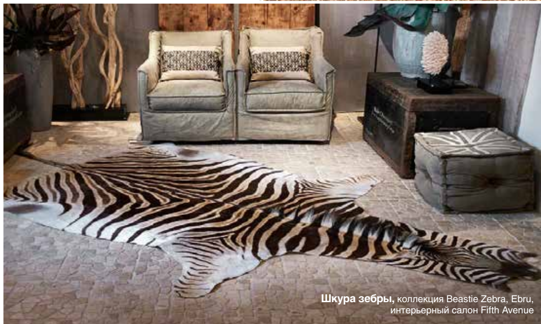
Шкура зебры, коллекция Beastie Zebra, Ebru, интерьерный салон Fifth Avenue