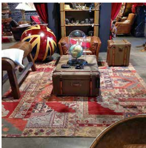
Персидский лоскутный ковер , коллекция Old Grand Library, дизайнер – Тимоти Оултон, (Timothy Oulton)