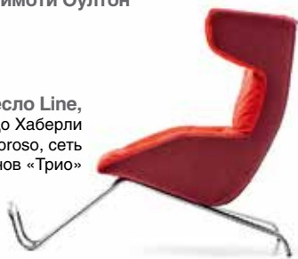
Кресло Line, дизайн – Альфредо Хаберли (Alfredo Haberli), Moroso, сеть интерьерных салонов «Трио»