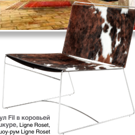
Стул Fil в коровьей шкуре, Ligne Roset, шоу-рум Ligne Roset