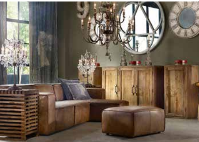
Интерьер лофта от дизайнера Тимоти Оултон (Timothy Oulton)

В лофте обязательно должно найтись место для современной скульптуры, живописи, графики, антиквариата. Мебели обычно немного, и она не привязана к стенам. «Предпочтение лучше отдать винтажной или современной мебели, – рекомендует эксперт. – Традиционные материалы – кожа, сталь или алюминий, пластик, стекло, необработанное дерево. Есть вещи, которые стали негласным символом лофтов: длинные диваны, изгибающиеся в разных направлениях, массивные кожаные кресла, каркасные стеллажи из труб, металлические подвесные светильники, напоминающие производственные. Не чужды лофту и этнические элементы декора, иногда можно встретить даже классические предметы, например, золоченый комод в стиле рококо или кресло на изящных ножках и с резным изголовьем, но им отводится роль арт-объектов».