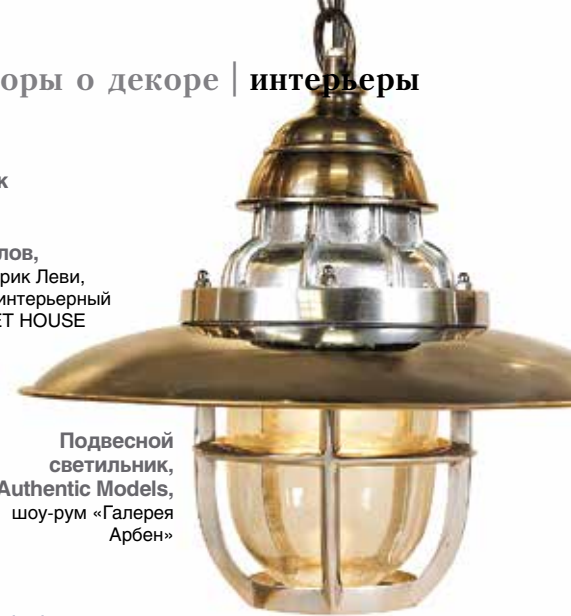
Подвесной светильник, Authentic Models, шоу-рум «Галерея Арбен»