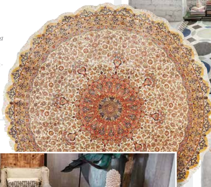
Иранский шелковый ковер кум, интерьерный салон DOVLET HOUSE