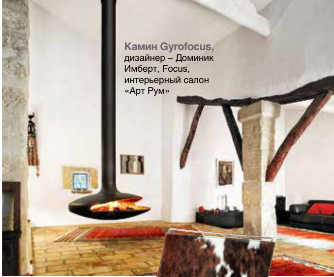
Камин Gyrofocus, дизайнер – Доминик Имберт, Focus, интерьерный салон «Арт Рум»