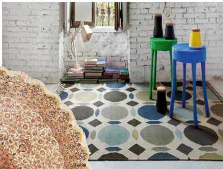
Шерстяной ковер ручной работы Kilim, GAN, www.shop.gan-rugs.com