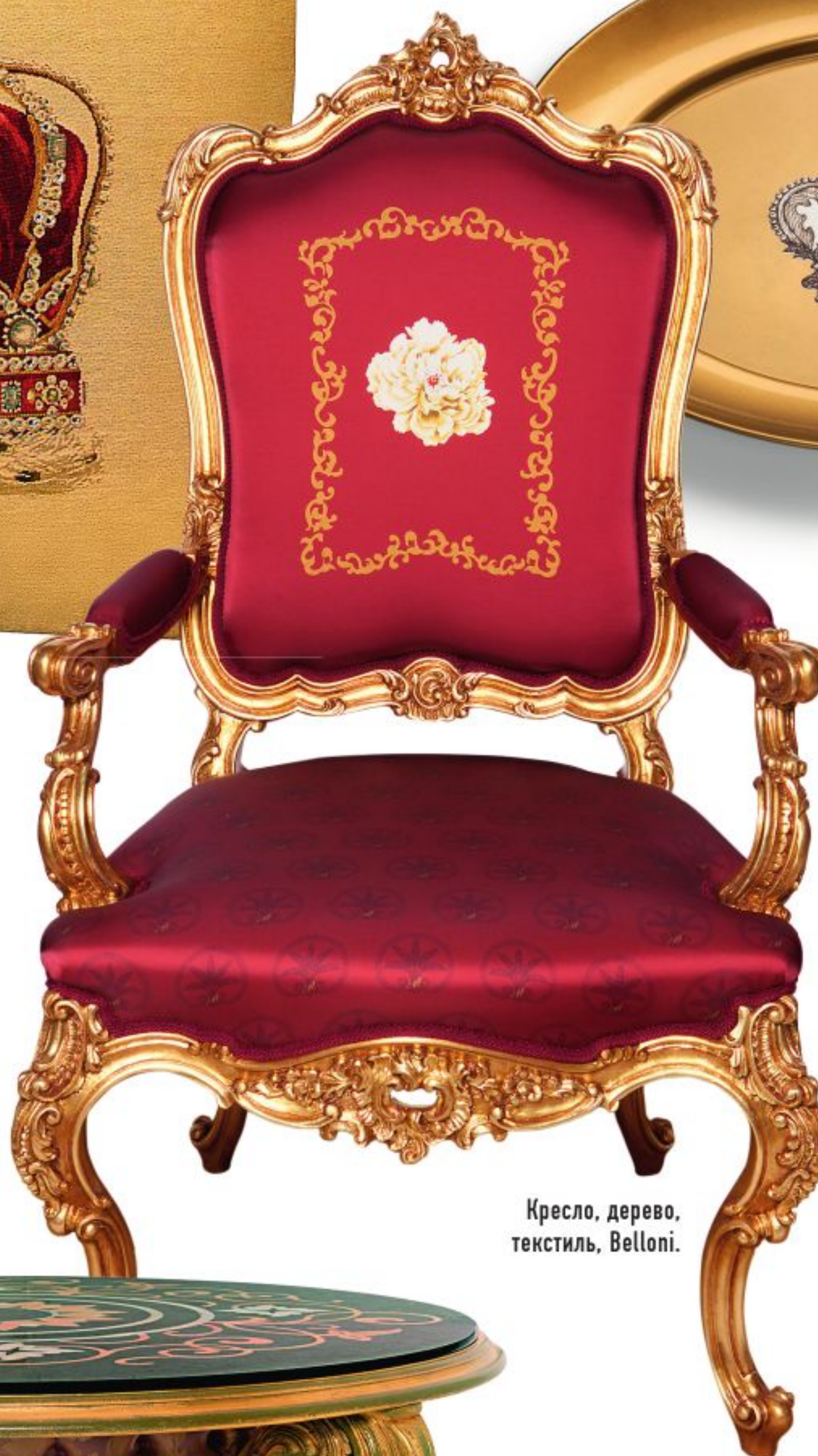
Кресло, дерево, текстиль, Belloni.