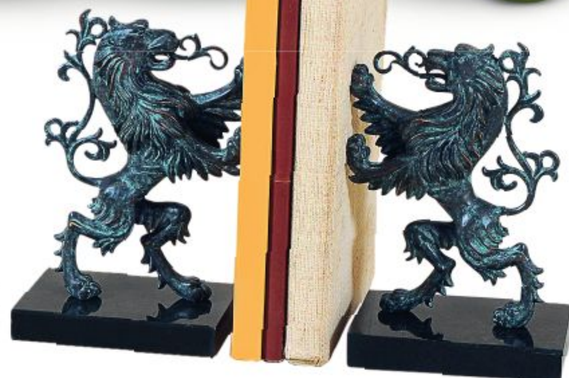
Держатели для книг, дерево, латунь, Maitland-Smith, 46 450 руб.