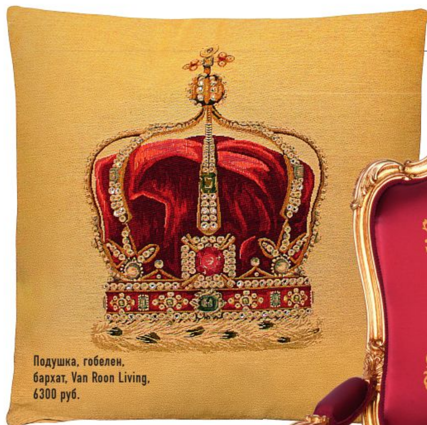
Подушка, гобелен, бархат, Van Roon Living, 6300 руб.