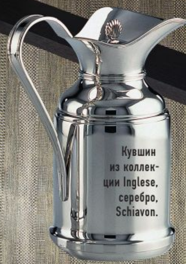
Кувшин из коллекции Inglese, серебро, Schiavon.