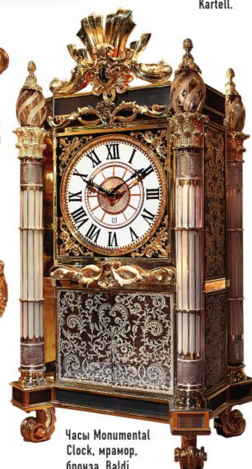
Часы Monumental Clock, мрамор, бронза, Baldi.