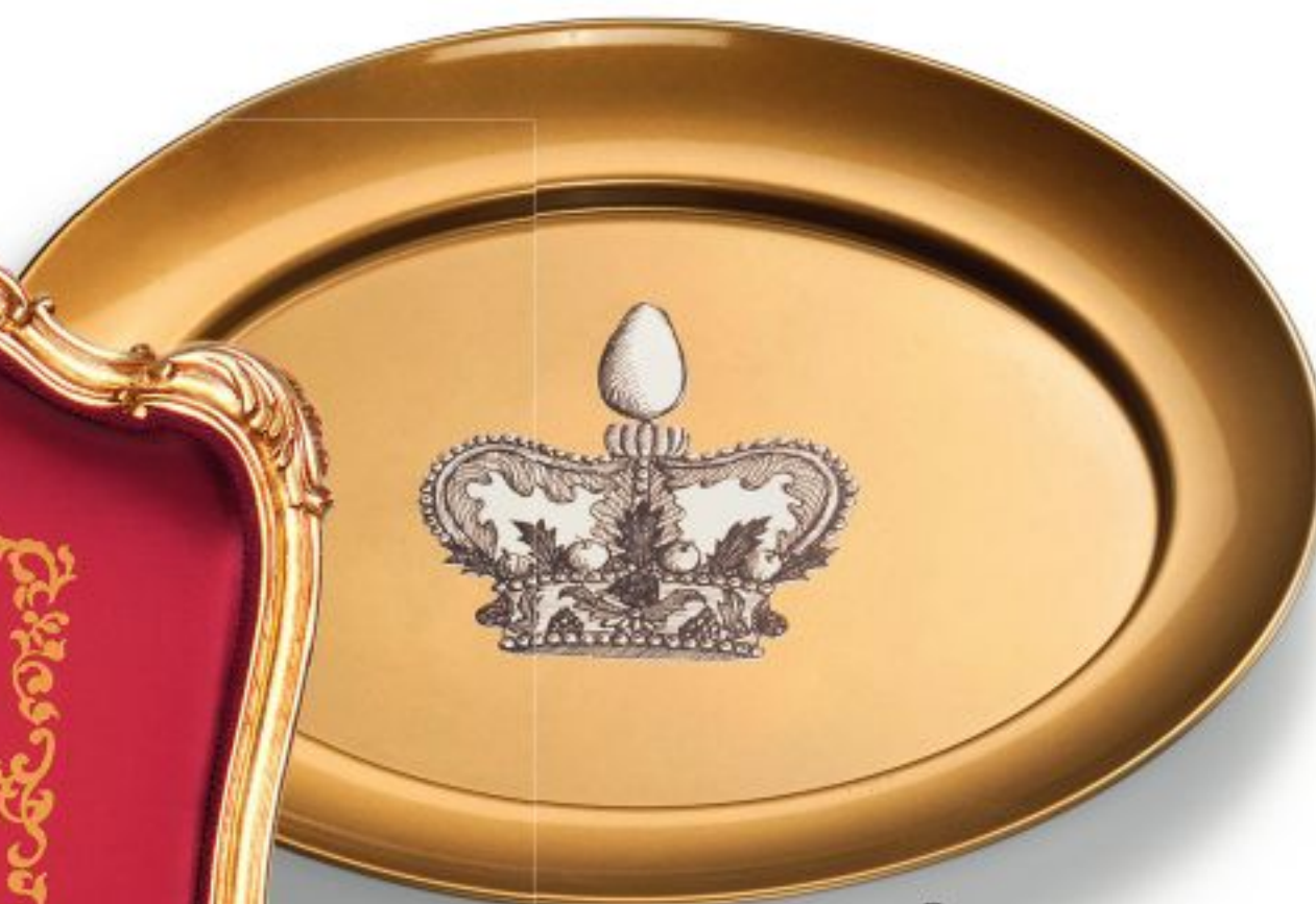
Тарелка из коллекции Ovo, меланин, дизайнер Патриция Уркиола, Kartell.