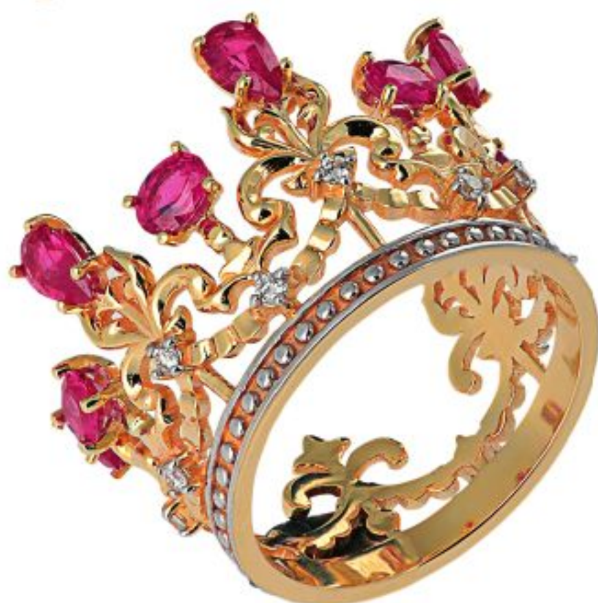
Кольцо "Царица Савская", золото, бриллианты, рубины, Axenoff Jewellery.