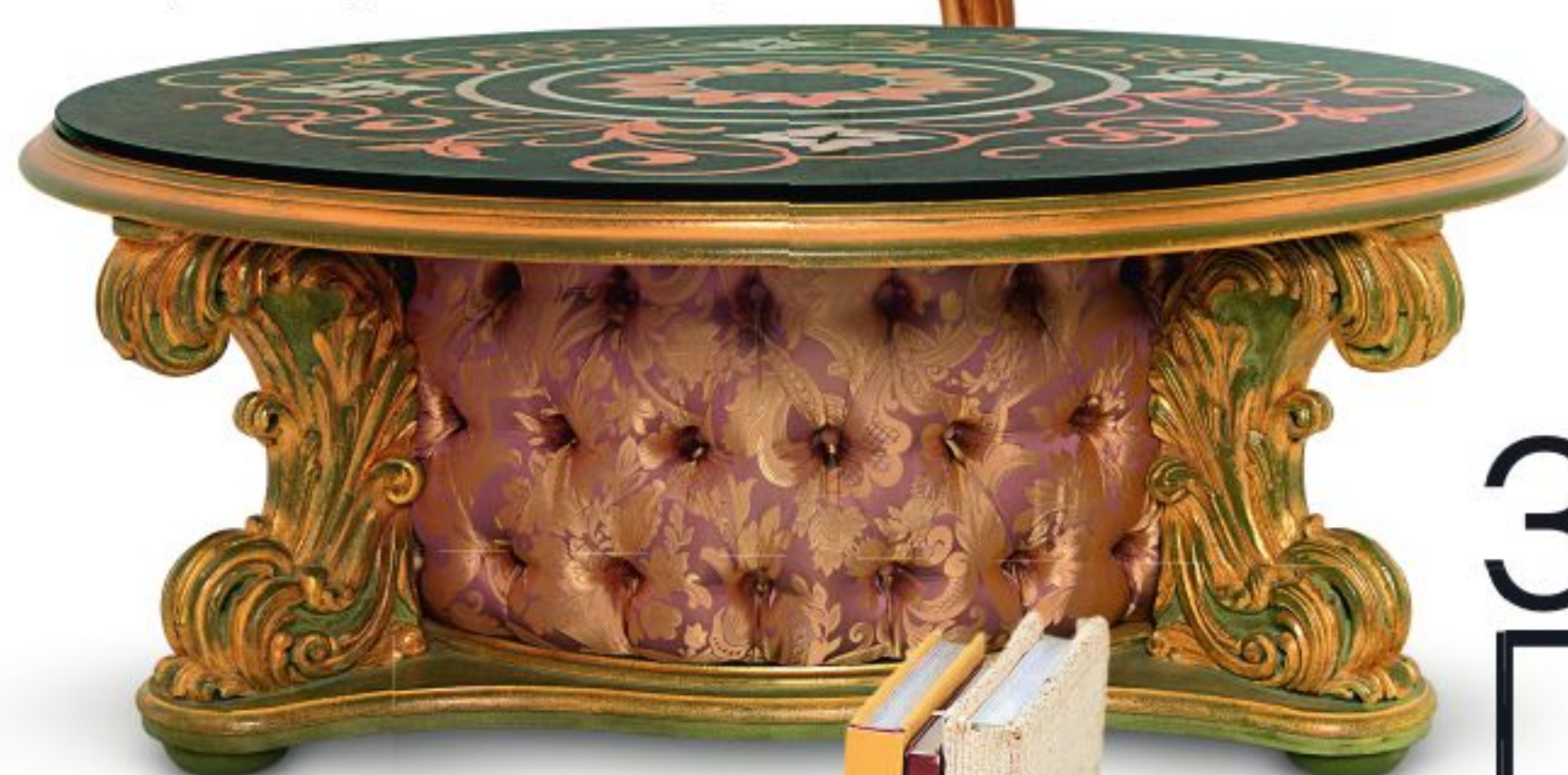
Стол Nabucco, текстиль, дерево, Asnaghi Interiors.