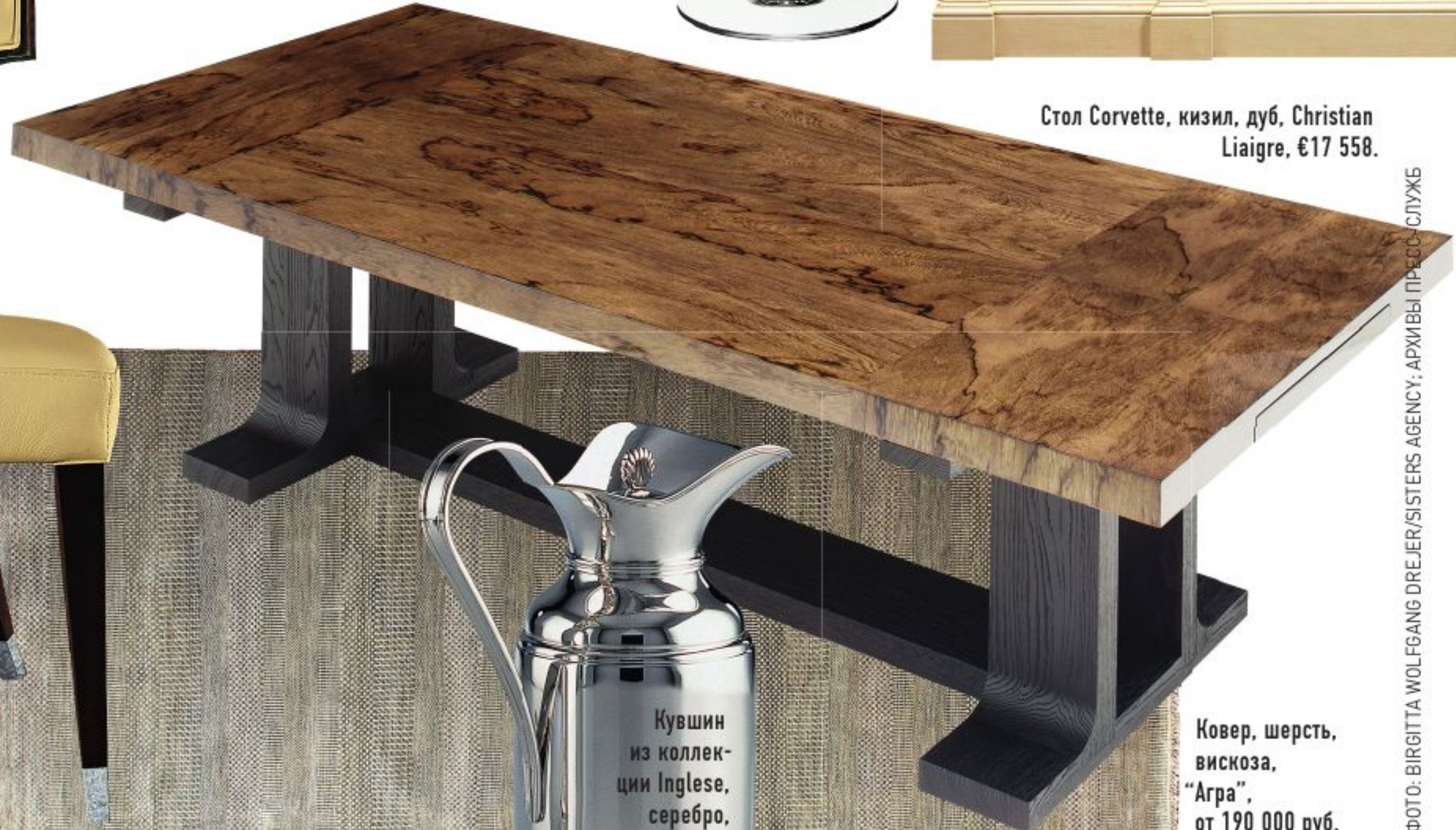
Стол Corvette, кизил, дуб, Christian Liaigre, €17 558.