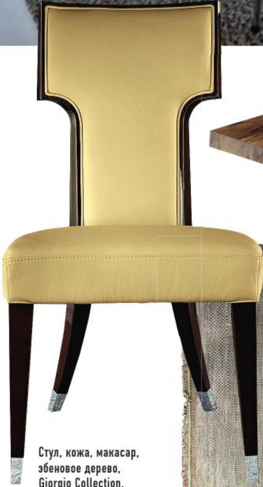
Стул, кожа, макасар, эбеновое дерево, Giorgio Collection.