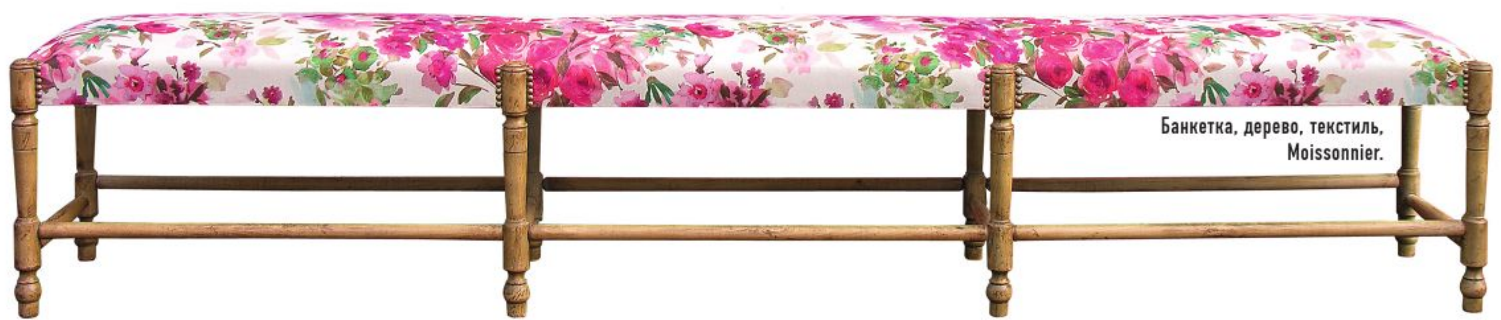
Банкетка, дерево, текстиль, Moissonnier.

Дизайнеры решили не оригинальничать. Весну встречают как положено — с цветами нежных оттенков.