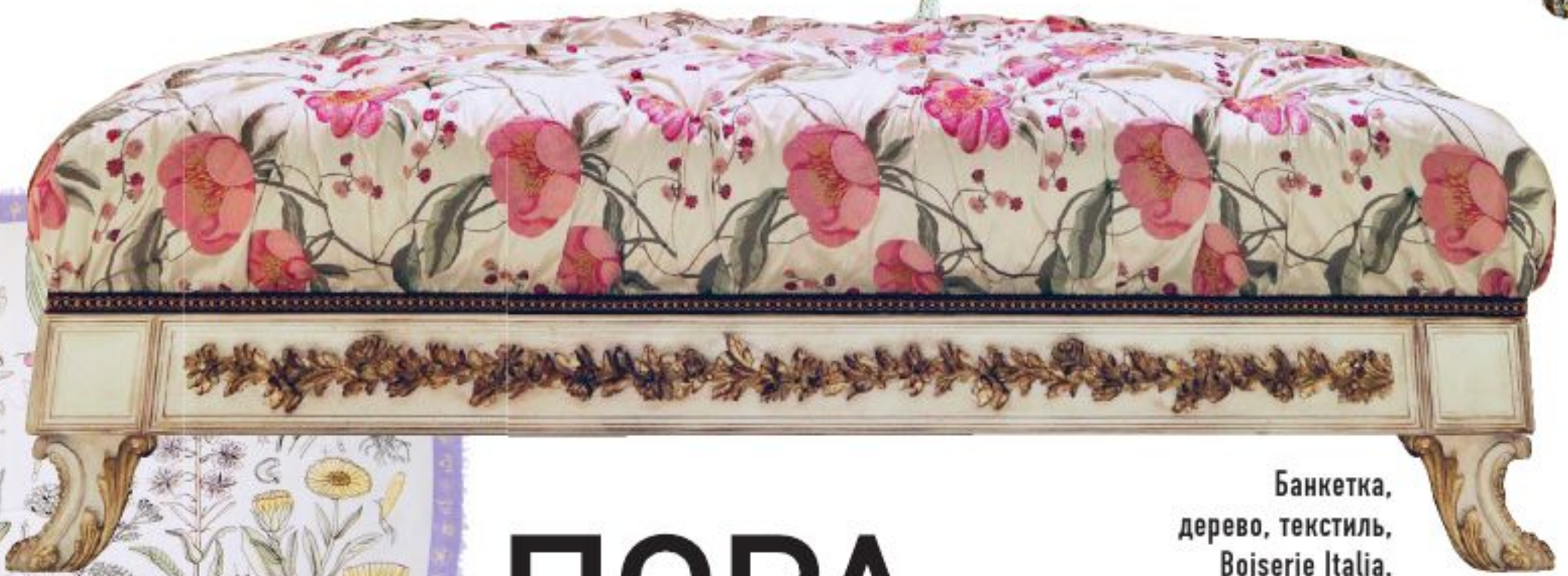
Банкетка, дерево, текстиль, Boiserie Italia.