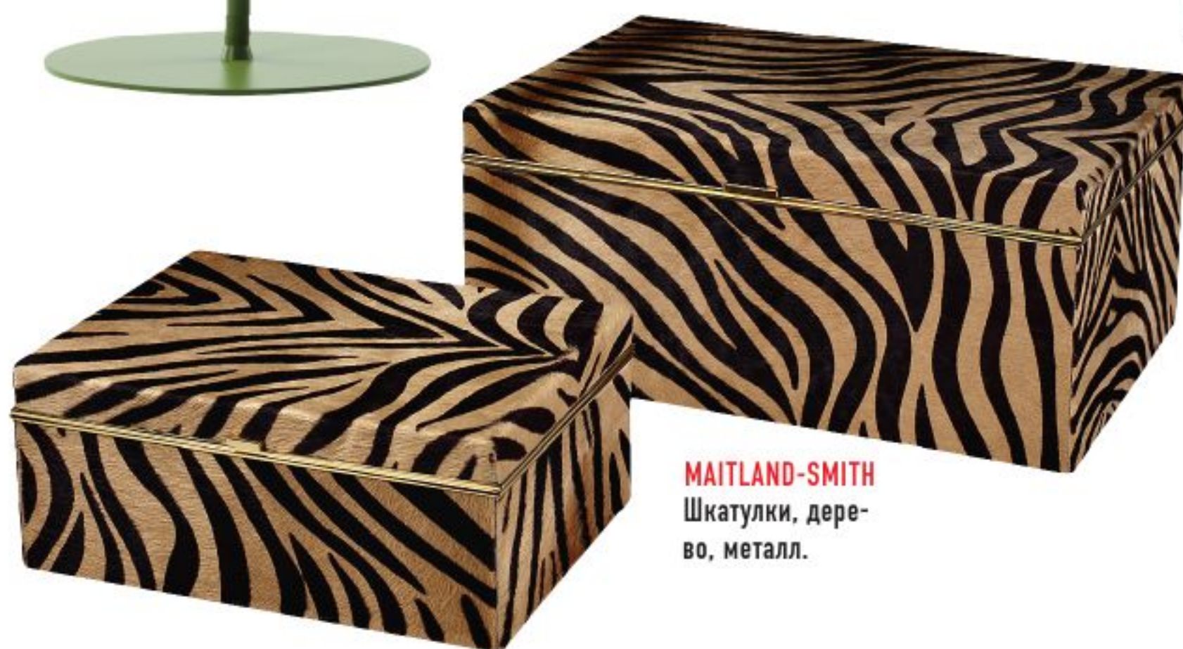
MAITLAND-SMITH Шкатулки, дере- во, металл.