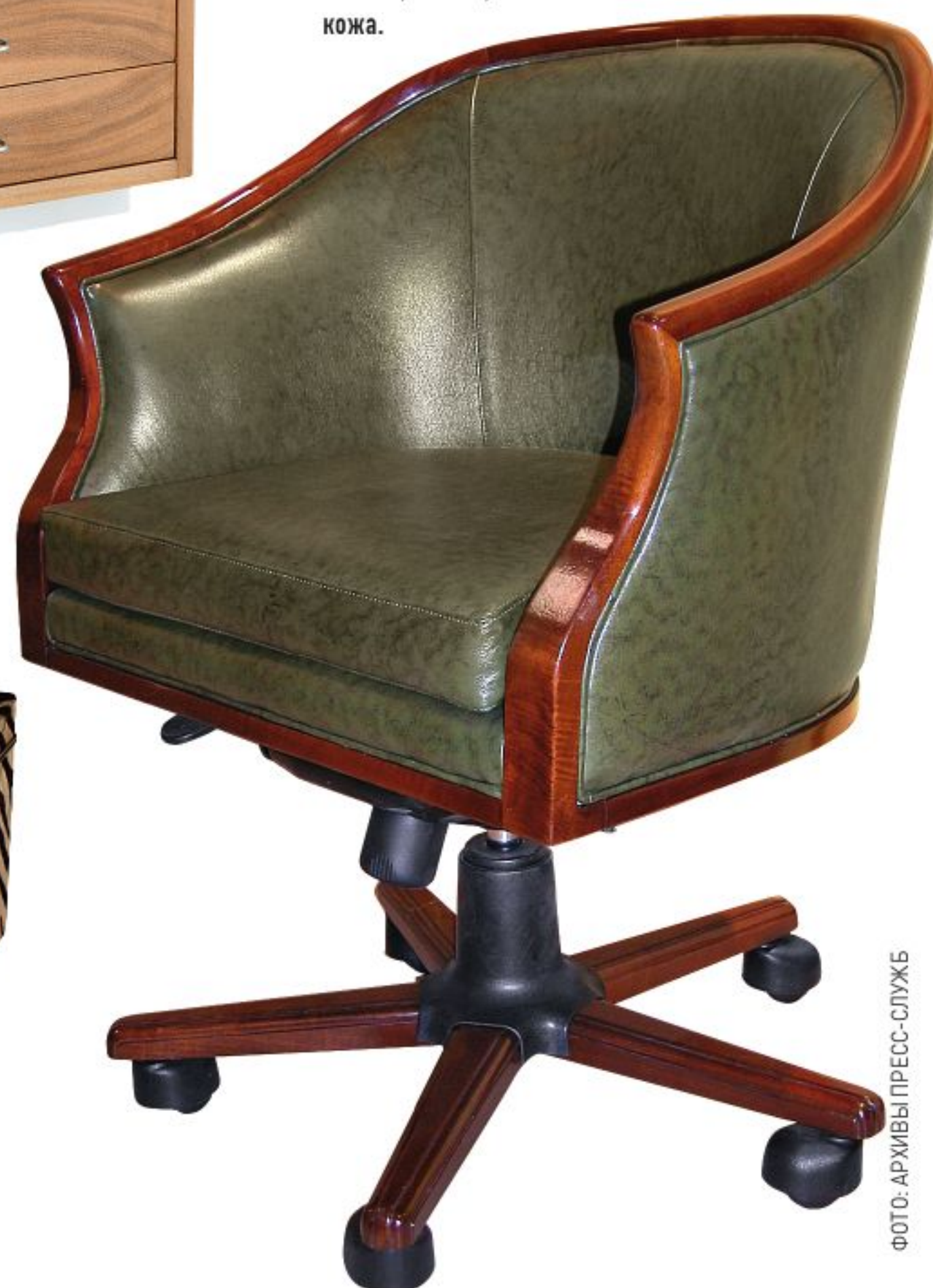
ARCA Кресло Novalis, вишня, кожа.