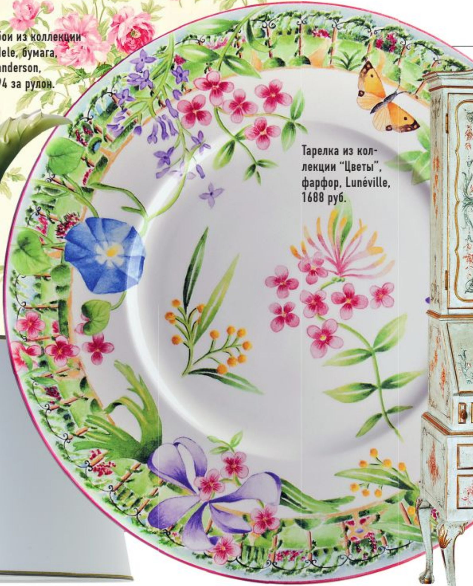
Тарелка из коллекции "Цветы", фарфор, Lunéville, 1688 руб.