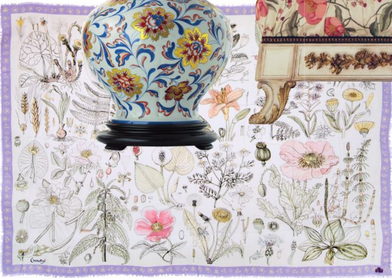
Шаль "Гербарий", вискоза, кашемир, Gourji, 22 000 руб.