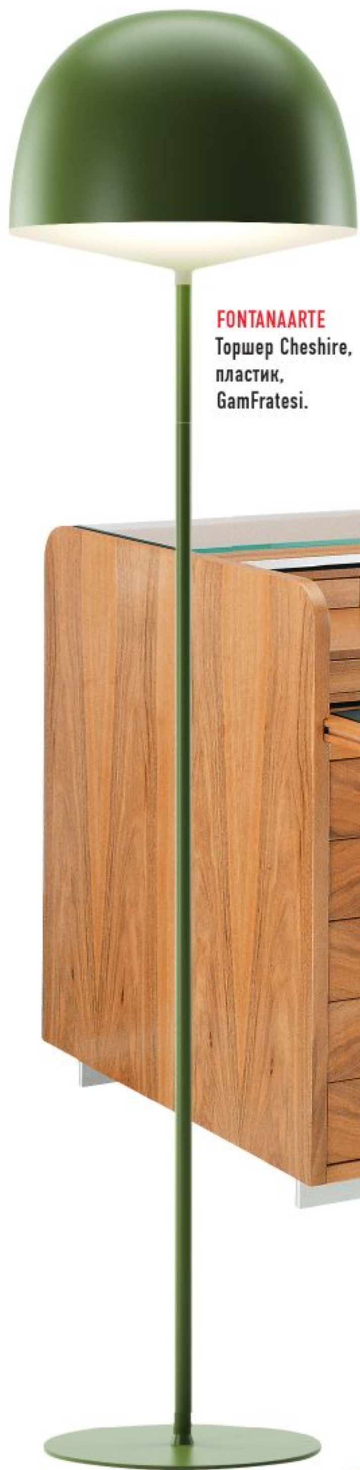
FONTANAARTE Торшер Cheshire, пластик, GamFratesi.