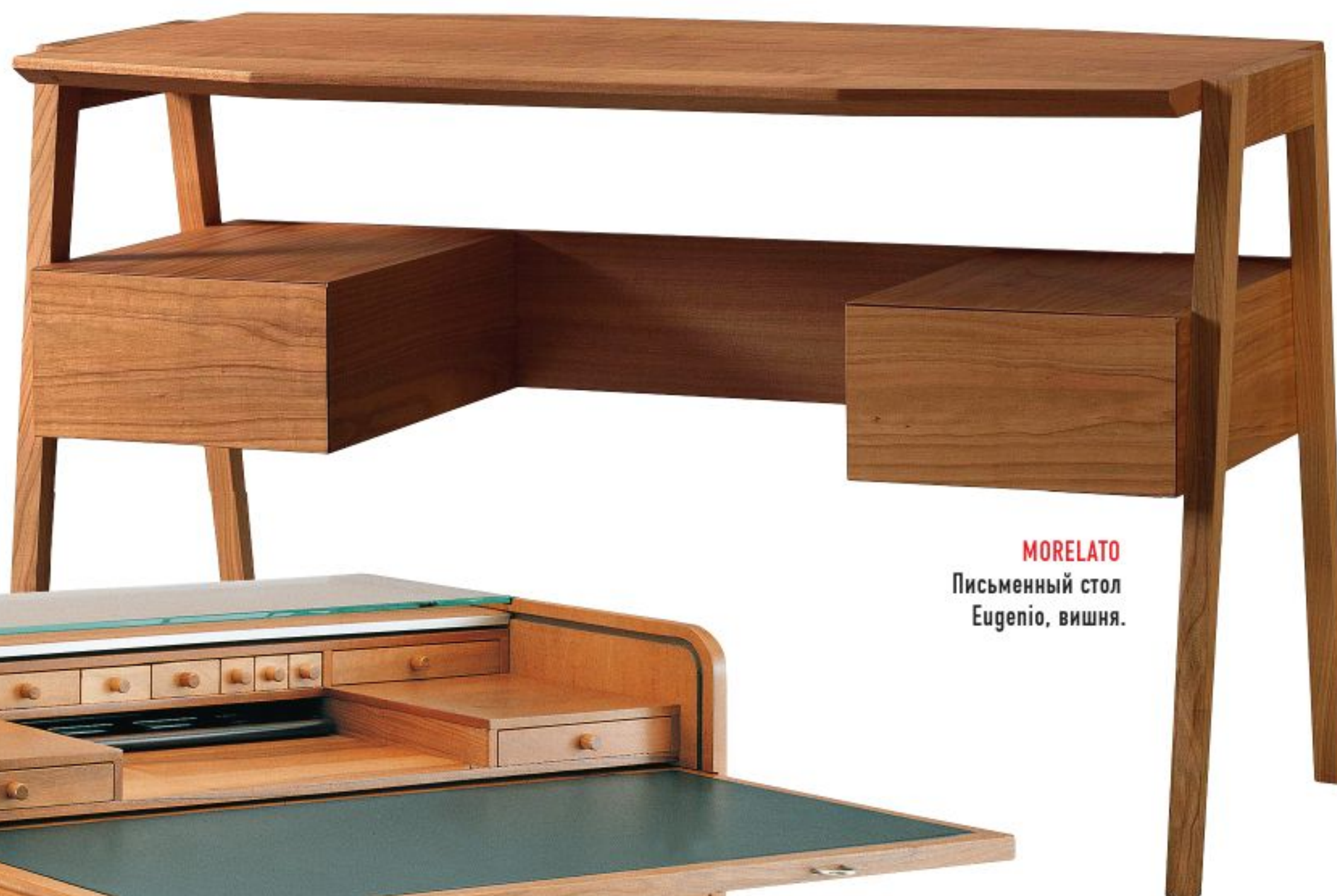
MORELATO Письменный стол Eugenio, вишня.