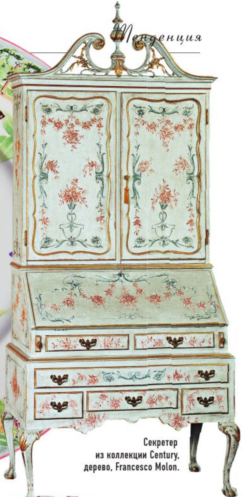
Секретер из коллекции Century, дерево, Francesco Molon.