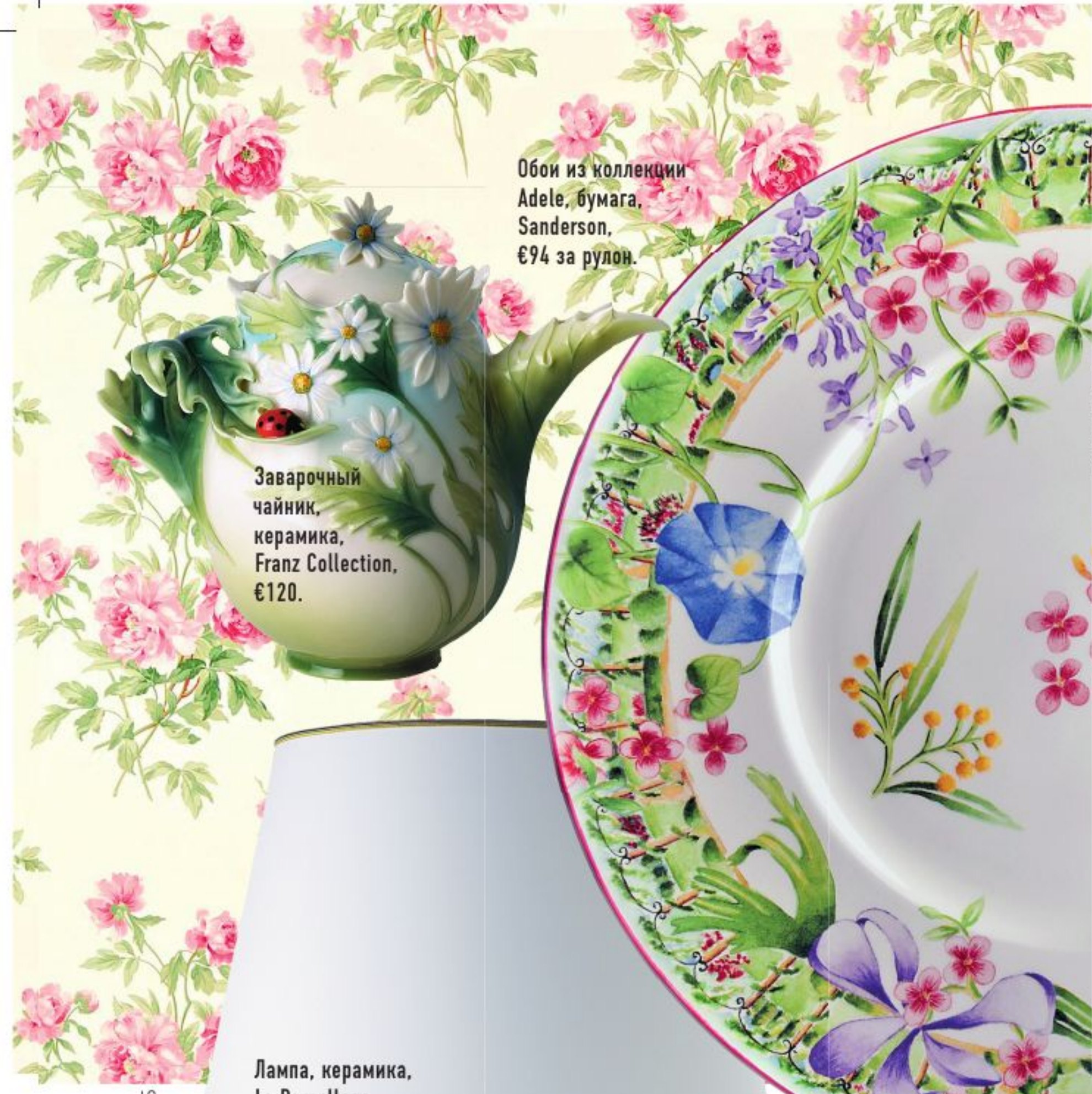
Обои из коллекции Adele, бумага, Sanderson, €94 за рулон.