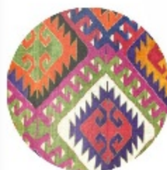
KILIM WARE HOUSE