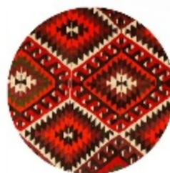
KILIM RUG AVENUE