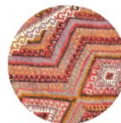
TURKISH KILIM HOUSE

THE RUG COMPANY | ART DE VIVRE | ANSY CARPET GALLERY | HERIZ | DOWLET HOUSE | SANAM CARPET | IRAN CARPETS