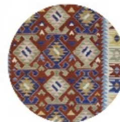
KILIM RUG ART