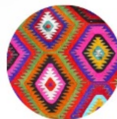
KILIM RUGS STORE